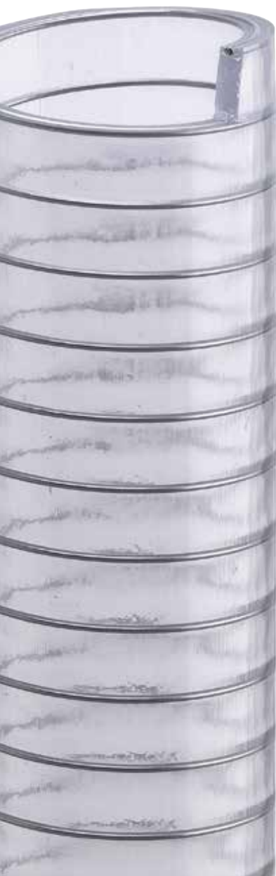
Scheda tecnica / Technical data