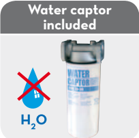
Water captor included