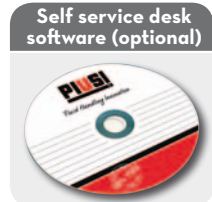
Self service desk software (optional)