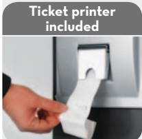
Ticket printer included