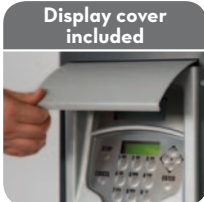
Display cover included