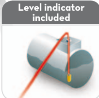
Level indicator included