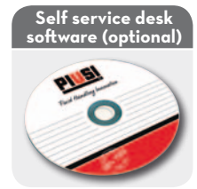
See "Fluid monitoring" section