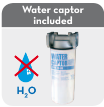
(only column versions)